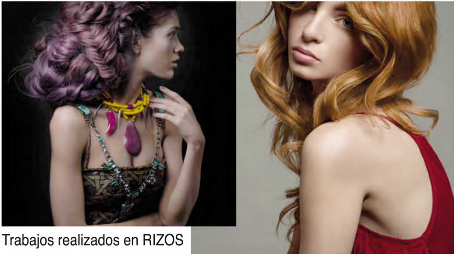
Trabajos realizados en RIZOS

RIZOS DOMINGO 27 DE NOVIEMBRE 11:45 horas The Beauty Boutique GALA DE RIZOS