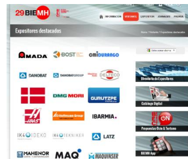
Logos en listado expositores destacados