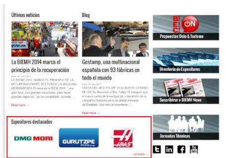
Logos en home