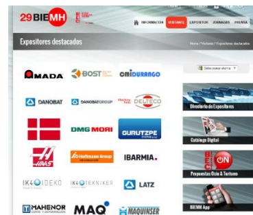
Logos en listado expositores destacados