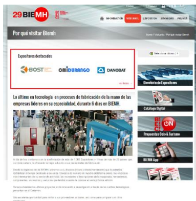
Logos en sección visitantes: por qué visitar