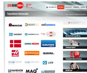
Logos en listado expositores destacados