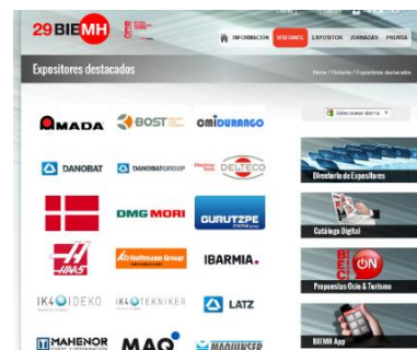
Logos en listado expositores destacados