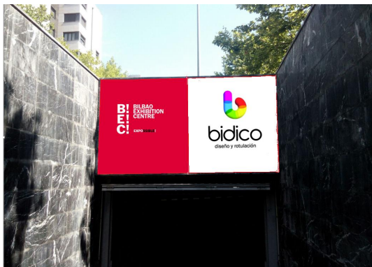
Imagen en Portón de Acceso al parking