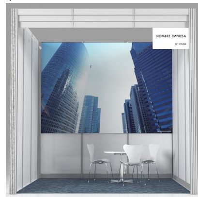
Tarifas (IVA no incluido):