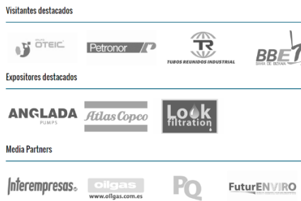
Logos en home