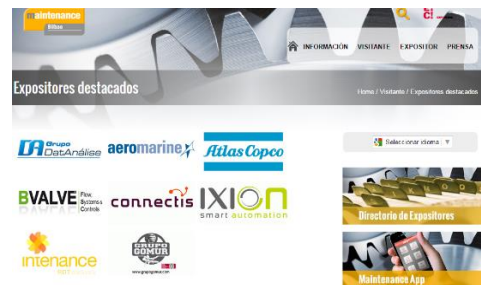
Logos en listado expositores destacados