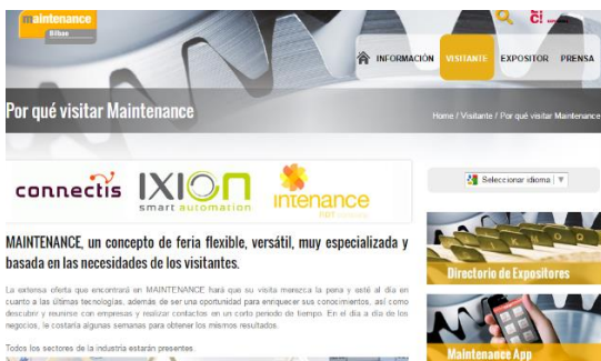
Logos en sección visitantes: por qué visitar