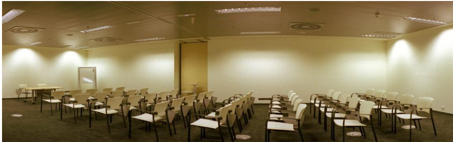
Sala 3 (capacidad 80 pax)