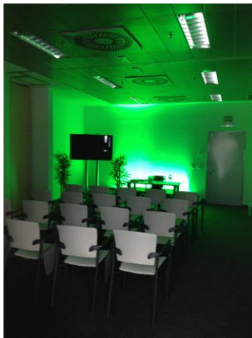
Sala 5 (capacidad maxima 30 pax)