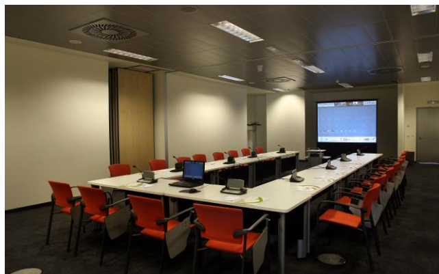
Sala formato "U" (capacidad max 32 pax)