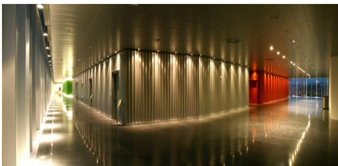
Pasillo perimetral exterior